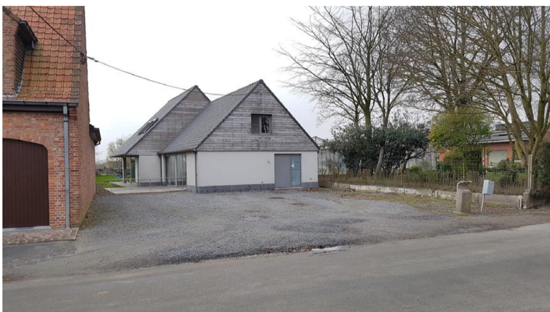
Op deze oprit stond vroeger de herberg De Wagenmakerij .